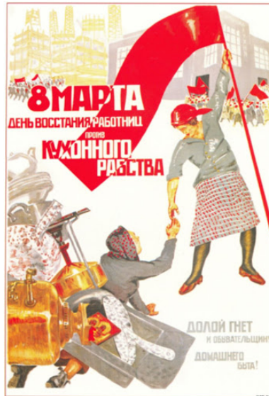
Affiche soviétique de 1932 (écrite en russe) pour célébrer le 8 mars

Le 8 mars 1917, des ouvrières de Saint-Pétersbourg, une grande ville de Russie, manifestent pour « du pain et pour la paix ». Cette manifestation a joué un rôle important dans la révolution russe de 1917. En 1921, le dirigeant communiste Lénine fait d'ailleurs du 8 mars la journée pour les droits des femmes en Russie (qui deviendra l'URSS en 1922).