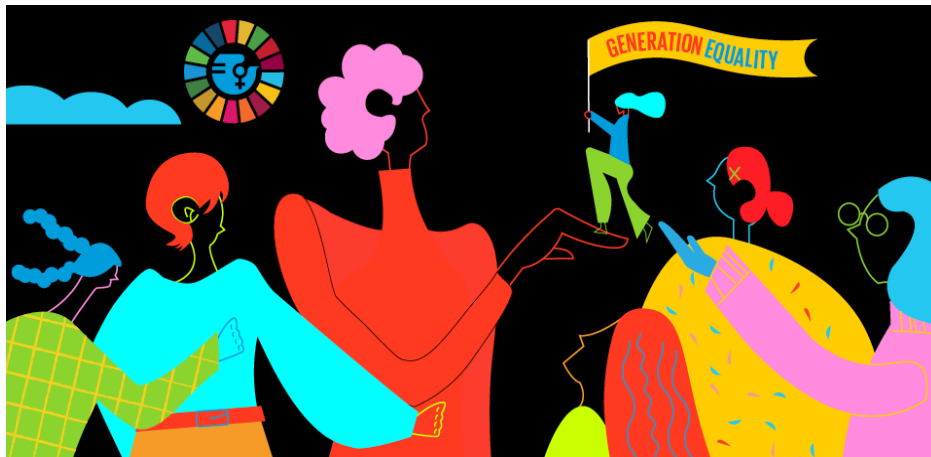
L'affiche des Nations Unies pour la journée du 8 mars 2021, « generation equality » en anglais, « génération égalité » en français

En 1977, l'Organisation des Nations Unies déclare le 8 mars comme « journée internationale pour le droit des femmes et pour la paix. » L'ONU voulait associer le droit des femmes et la paix pour rappeler que, dans l'histoire, les femmes avaient associé la lutte pour leurs droits et la lutte pour la paix. Très vite dans le langage courant, la journée internationale pour le droit des femmes et pour la paix internationale est devenue simplement la journée des femmes et même de la femme. Très vite aussi, les magasins en ont profité pour faire, le 8 mars, des publicités pour les parfums et d'autres produits dits féminins. Vue ainsi, la journée du 8 mars renvoyait à l'image traditionnelle de la femme : séduisante, bonne mère, bonne compagne, bonne femme au foyer, mais pas une citoyenne avec les mêmes droits que les hommes. La journée de la femme risquait de devenir le contraire de la lutte pour les droits des femmes et pour l'égalité. Heureusement, les associations féministes ont continué et continuent le combat.